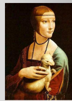
© MEMLING AND WITTMAN, LONDON, 1489-90